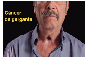
Cáncer de garganta