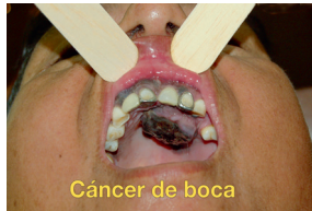
Cáncer de boca