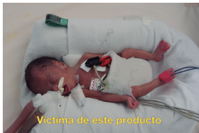
Víctima de este producto

Atrévete a dejar de fumar. Llámamos 01 800 966 3863