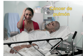
Cáncer de pulmón