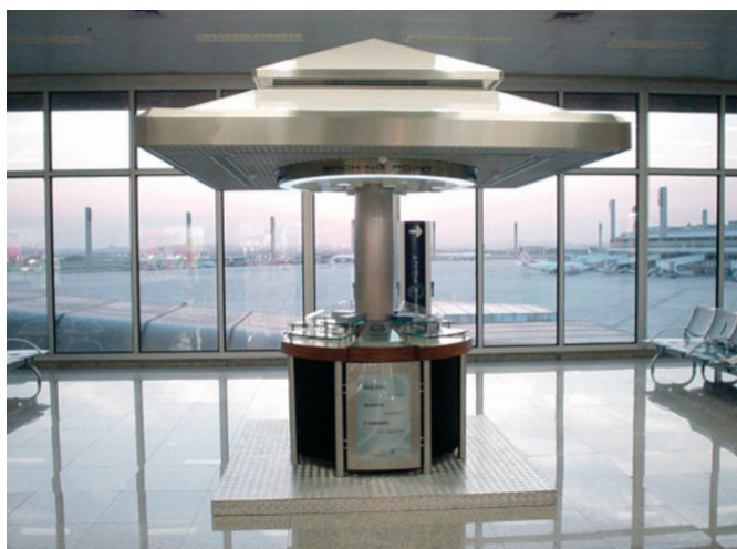
«Точка для курения» компании BAT, 2004 г. 63