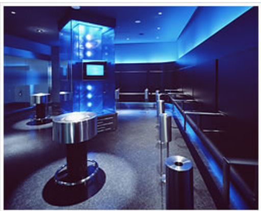
«Точка для курения» в аэропорту Ханэда - крупнейшем аэропорту Японии (2007 г.) 70

В 2007 году компания JTI «создала более чем 200 наружных стеклянных залов для курения в комплекте с обслуживающим персоналом, туалетами и пепельницами». 64 К концу 2008 года компания планировала создать вентилируемые зоны для курения «в 15 международных аэропортах, включая 46 залов для курения, 70 кабин для курения и более 60 точек для курения». 65 Компания JTI рекламировала помещения для курящих в Международном аэропорту Нарита (2006 г.) 66 , аэропорту Син-Титосэ в японской провинции Хоккайдо (2003 г.) 67 и аэропорту Ханэда, крупнейшем аэропорту в Японии (2007 г.). 68 В Японии компания Philip Morris также вступала в непосредственный контакт с японским производителем вентиляционных систем, по всей видимости, для оценки систем вентиляции. 69