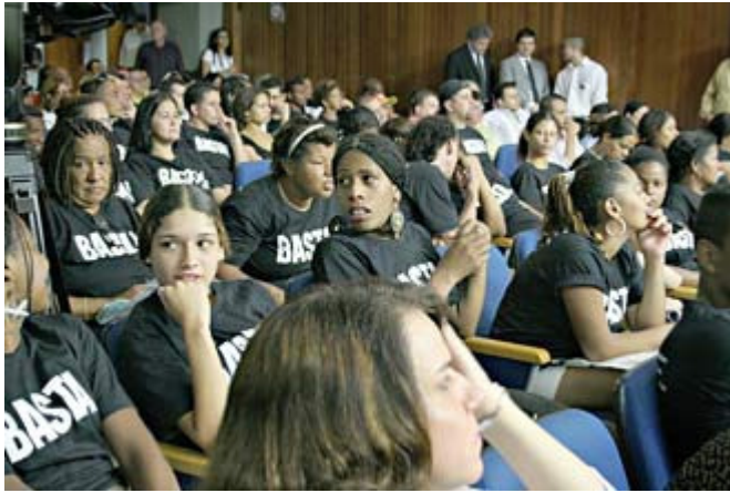
Акция протеста, организованная производителями табачных изделий. На футболках написано «Хватит» (Basta). 37