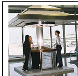
Фотография «точки для курения», опубликованная на сайте компании BAT.

В 2007 году компания JTI «создала более чем 200 наружных стеклянных залов для курения в комплекте с обслуживающим персоналом, туалетами и пепельницами». 64 К концу 2008 года компания планировала создать вентилируемые зоны для курения «в 15 международных аэропортах, включая 46 залов для курения, 70 кабин для курения и более 60 точек для курения». 65 Компания JTI рекламировала помещения для курящих в Международном аэропорту Нарита (2006 г.) 66 , аэропорту Син-Титосэ в японской провинции Хоккайдо (2003 г.) 67 и аэропорту Ханэда, крупнейшем аэропорту в Японии (2007 г.). 68 В Японии компания Philip Morris также вступала в непосредственный контакт с японским производителем вентиляционных систем, по всей видимости, для оценки систем вентиляции. 69