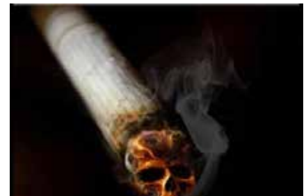
Smoking causes early death