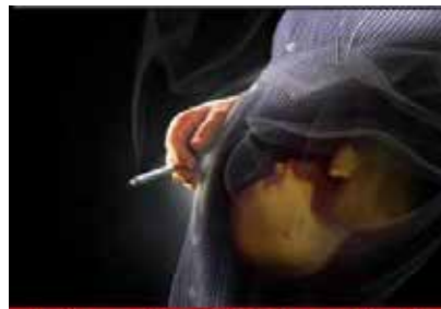
Passive smoking affects fetus and leads to growth retardation and premature labor