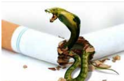
Cigarettes contain more than 4000 toxic substances and causes death