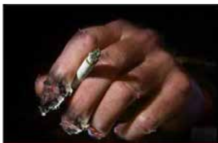
Smoking increases risk of more than 25 diseases including cancer and cardiovascular disease