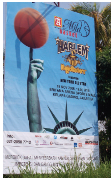
Patrocinio del basquetbol, Indonesia