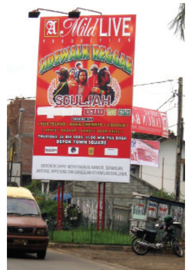
Cartel publicitario de un concierto de música, Indonesia