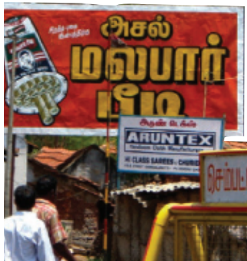
Cartel publicitario del tabaco, India