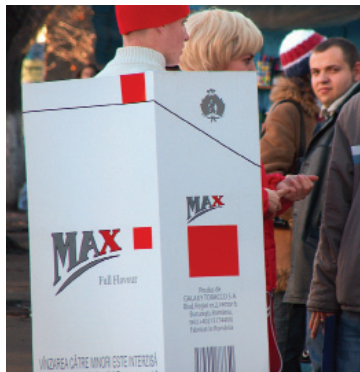
Publicidad con caja de cigarrillos ambulante, Moldavia.

—Informe MPOWER de la Organización Mundial de la Salud, 2008. 1