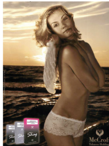
Anuncio publicitario de los cigarrillos Shag, Sudáfrica