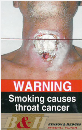
الحجم: 85% (الهند عام 2016)

تنص المادة 11 من اتفاقية منظمة الصحة العالمية الإطارية بشأن مكافحة التبغ أنه ينبغي أن تغطي التحذيرات الصحية 50% من مساحة العرض الرئيسية لعبوة التبغ، ولكن كحد أدنى يجب أن تغطي ما لا يقل عن 30% من هذه المساحة.