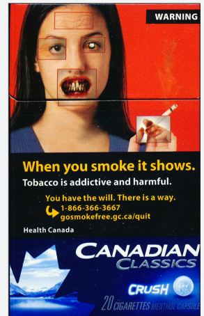
الحجم: 75% كندا عام (2012)