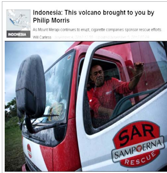
Foto de un artículo de Global Post sobre las actividades de rescate de Sampoerna en Indonesia. 33