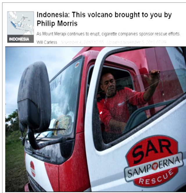
Foto de um artigo no Global Post sobre as atividades de resgate da Sampoerna na Indonésia. 33

rodeia seus produtos mortais, e neutralizando a oposição dos defensores do controle do tabaco.