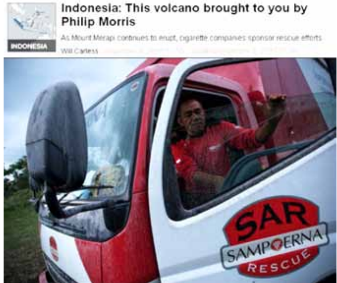
《环球邮报》关于Sampoerna在印度尼西亚救灾报道中的照片。 33